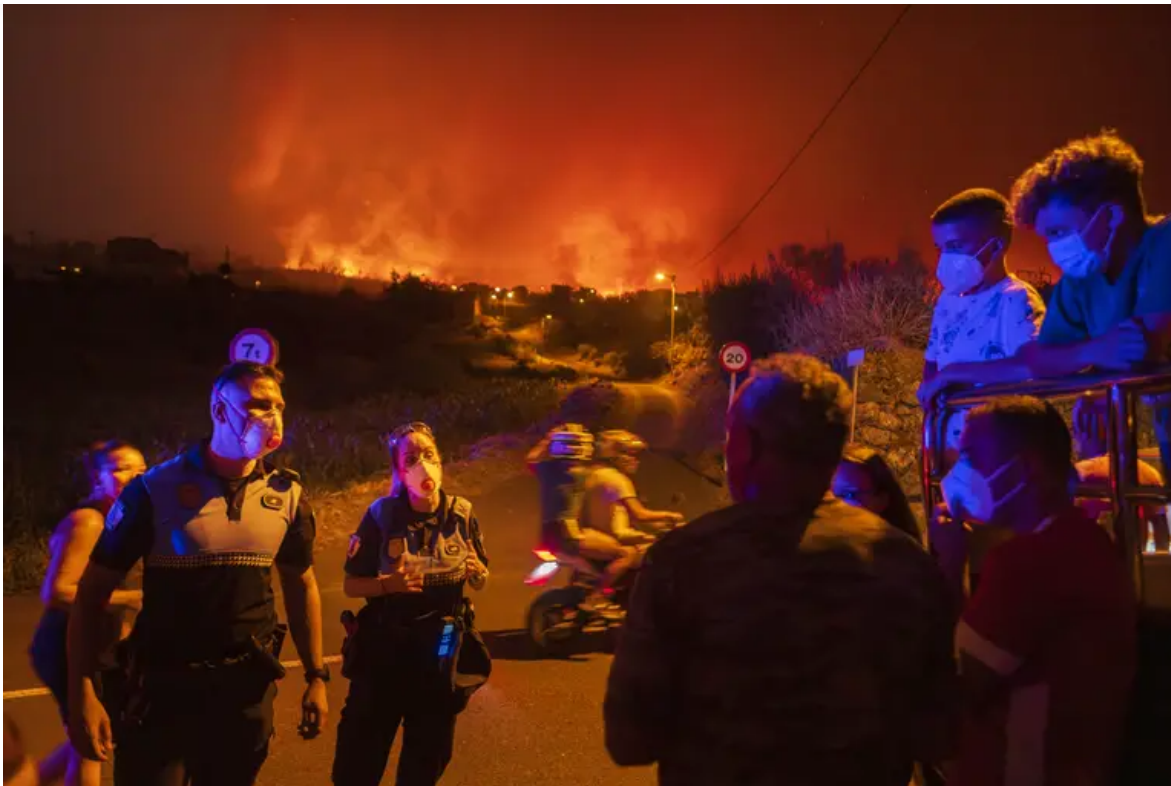
Incendios en Tenerife, el 19 de agosto.